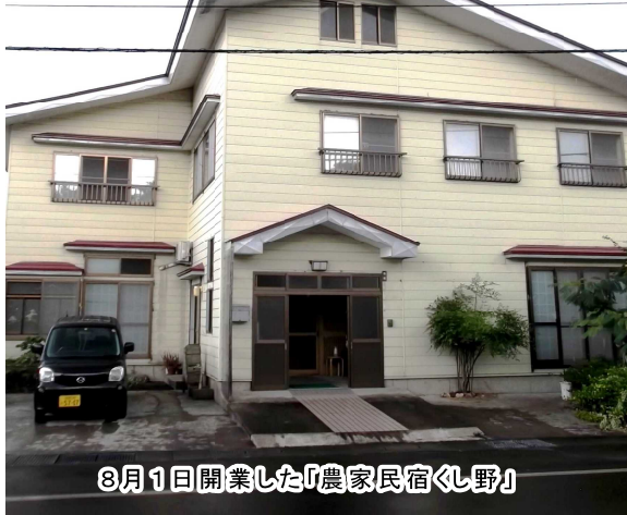
8月1日開業した「農家民宿くし野」

「農家民宿黄桜の宿くし野」が8月1日、館合地区館西にオープンしました。NPO法人黄桜の宿は、「農家民宿黄桜の宿」を平成27年7月から老方地区西ノ浜の空き家を借りて営業