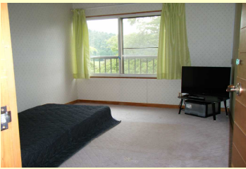
個室にベット・テレビなど設置