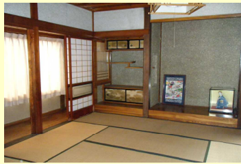
和室(8~10畳)の利用も可能