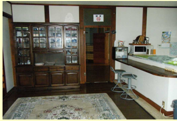
共用部分のキッチン・食堂